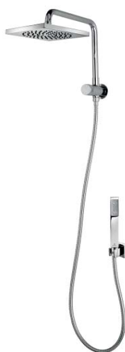
Immagine Prodotto - Product Image

Поворотный держатель для душа из латуни, соединение на 1/2" MM с интегрированным переключающим душ Cube, душевая лейка Cube с фиксированным настенным держателем и шланг