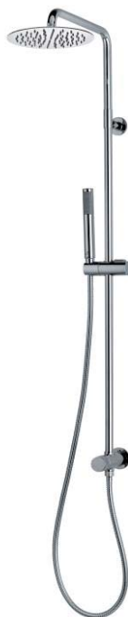
Immagine Prodotto - Product image

Колонна настенная из латуни Ø 20 мм, нижнее крепление с водорозеткой на 1/2"М, интегрированная система переключения - Душ TETIS Ø250 мм - Ручная лейка ZEN с поворотным держателем - Шланг дв. фальцевания 150 см 1/2" FF конусообразный