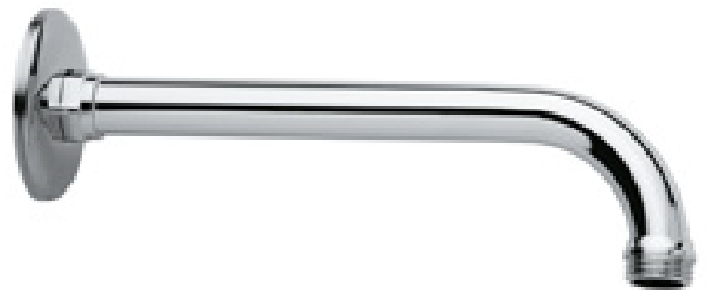
Immagine a puro scopo illustrativo.