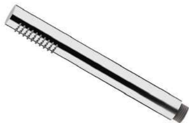
IMMAGINE - IMAGE