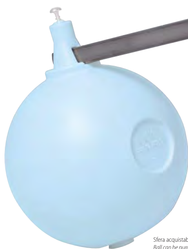
Sfera acquistabile a parte. Ball can be purchased separately.

Adjustable noiseless float valve in pressed and casting brass for high pressure equipped with inlet pipe, with flat rod.