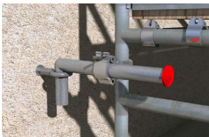
Ancoraggio Tubo A