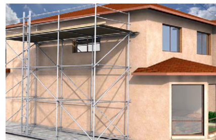
Ancoraggio Tubo PDL