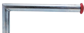
Tubo di ancoraggio A per golfare GP