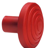
Tappo per tubo di ancoraggio