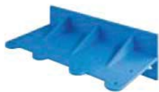
supporto murale -Mignon Duplex-