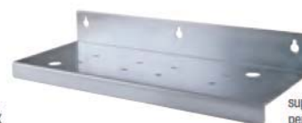
supporto murale -T- per versione TRIPLEX