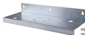
supporto murale -T- per versione TRIPLEX