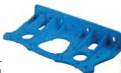
supporto murale -D- per versione DUPLEX