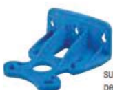
supporto murale -S- per versione singola