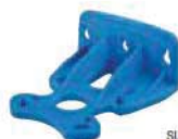
supporto murale -S-