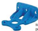
supporto murale -S- per versione singola