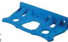
supporto murale -D- per versione DUPLEX