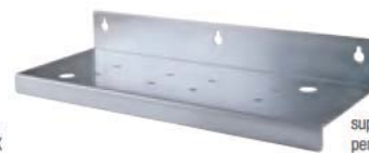
supporto murale -T- per versione TRIPLEX