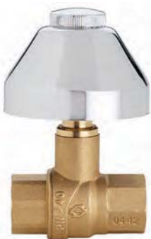
GP 2240 INCASSO

Valvola a sfera da incasso Femmina-Femmina sabbiata gialla, con Cappuccio e Campana cromati.