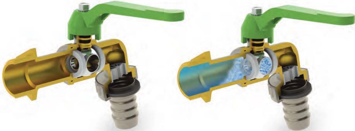
GP 2100 GARDEN ANTIGELO

L'acqua presenta una particolare proprietà quando passa dallo stato liquido a quello solido, infatti solidificando aumenta di volume. Per evitare di rovinare la parte meccanica della valvola, il rubinetto Garden Antigelo di FIV, possiede un particolare foro di sicurezza antigelo posizionato sulla sfera che permette al ghiaccio di espandersi verso la rete idrica quando il rubinetto è chiuso.