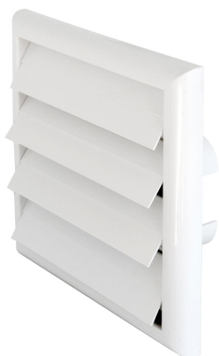
Griglia tipo "SU1818B" con alette a gravità