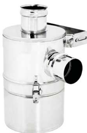
Art. NAB - Abbattitore di fuliggine ad acqua Water dust collector