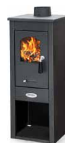
412-VLMAR-NE Nero Antracite