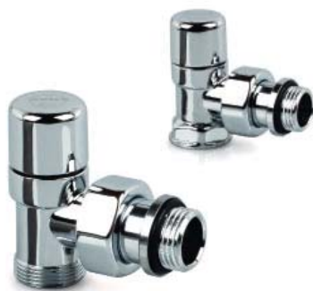
Detentori a squadra Angled lockshields

Detentori attacco per tubo rame e multistrato Lockshields, connection for copper and multilayer tubes